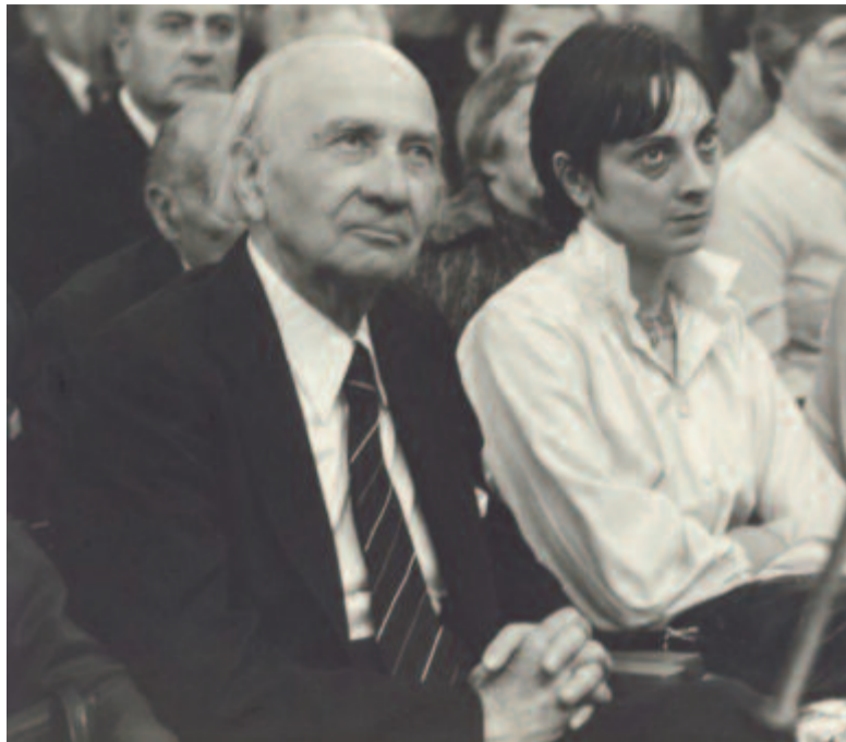
Illyés Gyula és lánya, Illyés Mária

Illyés Gyula arcát, a fiatal íróét és a gondok közt öregedőt ismerve, a szelíd kifejezést, az élénk, kedves mosolyát, mindig őszinte mivoltá-