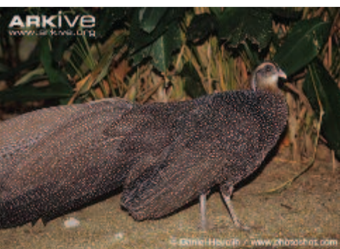
Gyöngyös páva ( Rheinardia acellata )

Középső farktollai az egész madárvilágban a leghosszabbak (nem számítva a tenyésztett főnixkakasét). A tollak szélessége 13 cm, hosszúságuk elérheti a 170 centit. Ezzel együtt a barna, fekete torkú kakas 240 cm