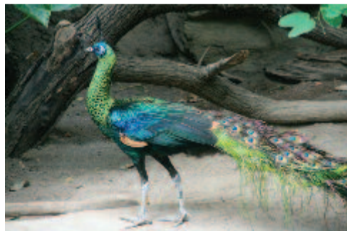
Gloriás páva ( Pava muticus ) – animalworld.com.ua

kakas mindkét középső farktolla 140 cm hosszú, és kis „pávaszemekkel” van tele-szórva. Ezekkel a hosszú tollakkal együtt a teljes hossza két métert is elér. Dürgekor büszkén díszelg velük. Ilyenkor a kakas felállítja farktollait, szárnyaival legezhető alakít, így kitűnően érvényesülnek a ragyogó „pávaszemek”. A pompás jelenségnek van árnyoldala is. Ilyen alkattal nem tud jól repülni. A szárnyai viszonylag rövidek, szokványos ütemű csapásokkal nehéz testét nem tudja eléggé emelni. 80 centi hosszú karevezői nem tudják segíteni a repülést. A tojó sokkal kisebb. Mindig csak két tojást rak. Jellemzője, hogy a kotlási idő alatt nem eszik, se nem