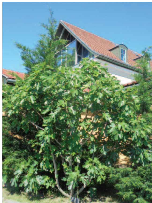
Száradjon el fügefástól, mér maradtunk el egymástól

...Tudom: vágni fogjuk kemény, vad sziklába az utat, melyen egy kemény, régi nép lép majd velünk és utánunk újra csak fel-felé – az 1921-es Kiáltó szó ...-ból idézek. – A mi igazságunk: a mi erőnk. Az lesz a mienk, amit ki tudunk küzdeni magunk-