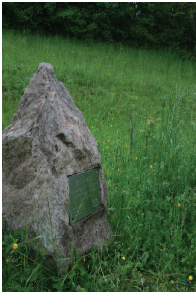
A Benkő József emlékarborétum és fűvészkert alapítóköve Középejártán

Kodály ötven – így kezdi Tamási Áron Kodály Zoltánról írott sorait a Pásztortűz 1933. januári első számában.