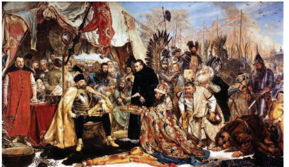
Báthory Pszkov előtt. Jan Matejko festménye

A harmadik évezred elején Báthory Istvánra Erdélyben és az anyaországban úgy kell tekintenünk, amiként Lengyelországban és Litvániában teszik, ahol kiemelt megbecsülésnek örvend. Mi, erdélyi magyarok igazán büszkék lehetünk egyik legjelentősebb fejedelmünk mai országhatárokon inneni és azokon túli tevékenységére, a jeles középkelet-európai államférfi „szűk hazánkon” messze túlmutató munkásságára, megvalósításaira és terveire. Az általa alapított kolozsvári jezsuita kollégiumra és vilniusi egyetemre egyaránt. Koronázási jelmondatára, miszerint: A nép királya vagyok, nem a lelkiismerete!